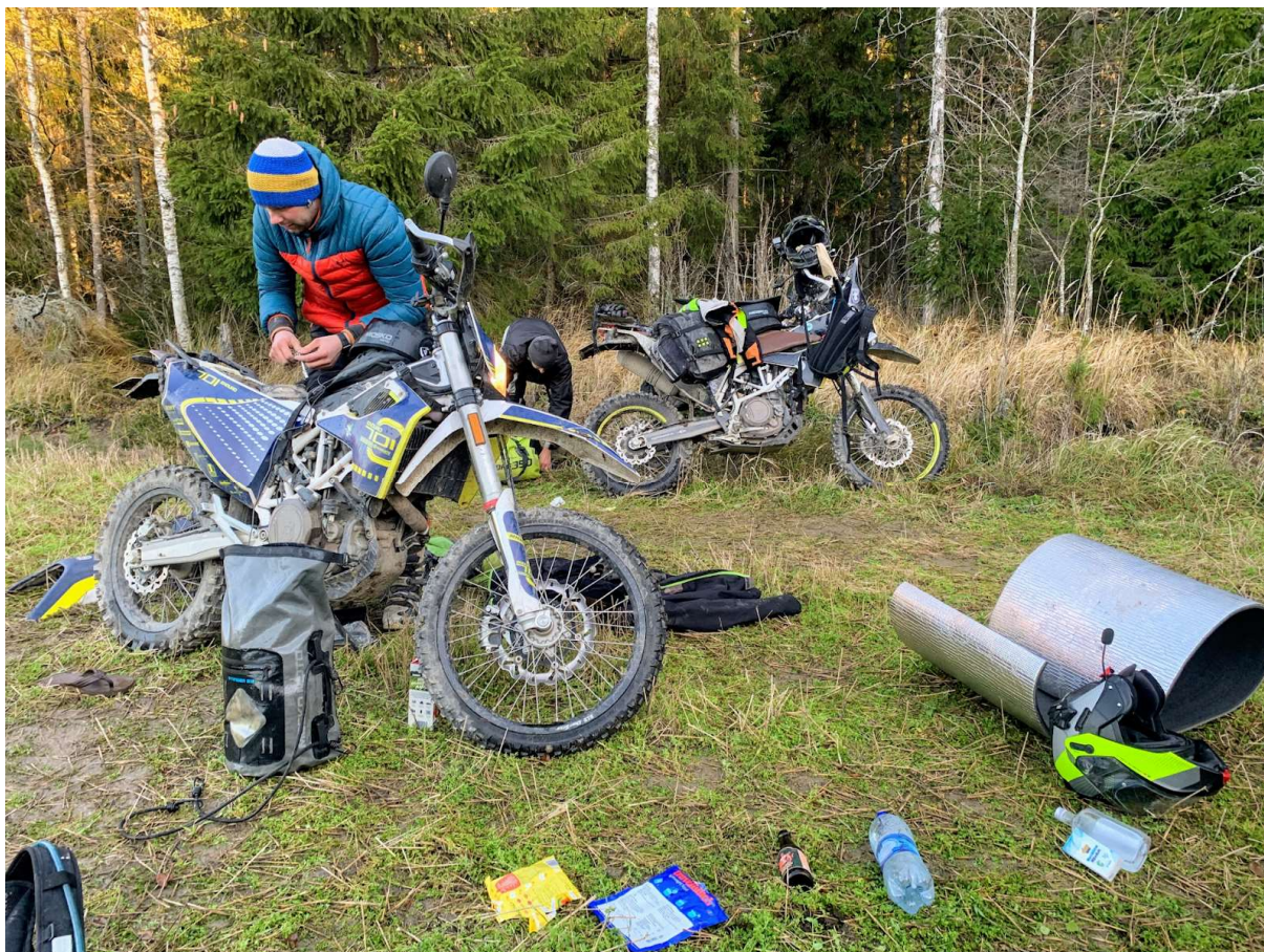
Tegime veel mõned fotod ja suundusime süüa otsima